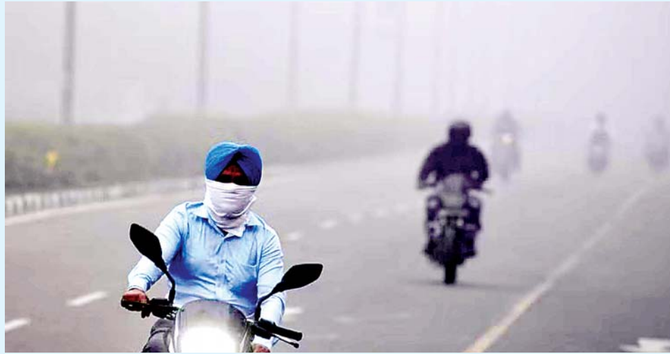
के लिए ऑरेंज अलर्ट जारी किया गया है, जबकि अन्य सभी जिलों में येलो अलर्ट जारी किया गया है।

मौसम विभाग के कोहरे के चलते पंजाब के 10 जिलों में ऑरेंज अलर्ट जारी किया गया है। अमृतसर, तरनतारन, कपूरथला, जालंधर, लुधियाना, बरनाला, मानसा, संगरूर, पटियाला और मलेरकोटला में कोहरे