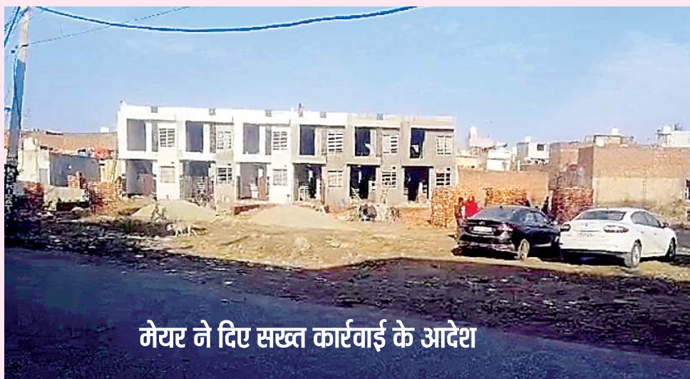
मेयर ने दिए सख्त कार्रवाई के आदेश

जालंधर( पंकज शर्मा ) : जालंधर वेस्ट के न्यू दशमेश नगर इलाके में धड़ल्ले से अवैध कॉलोनियों की कटाई और अवैध निर्माण का सिलसिला जारी है। चौंकाने वाली बात यह है कि ये अवैध कॉलोनी पार्श्व कार्यालय के सामने काटी जा रही है, जिसे राजनीतिक संरक्षण प्राप्त है। सूत्रों के मुताबिक, कॉलोनी के निर्माण में शामिल एक शूज निर्माता का