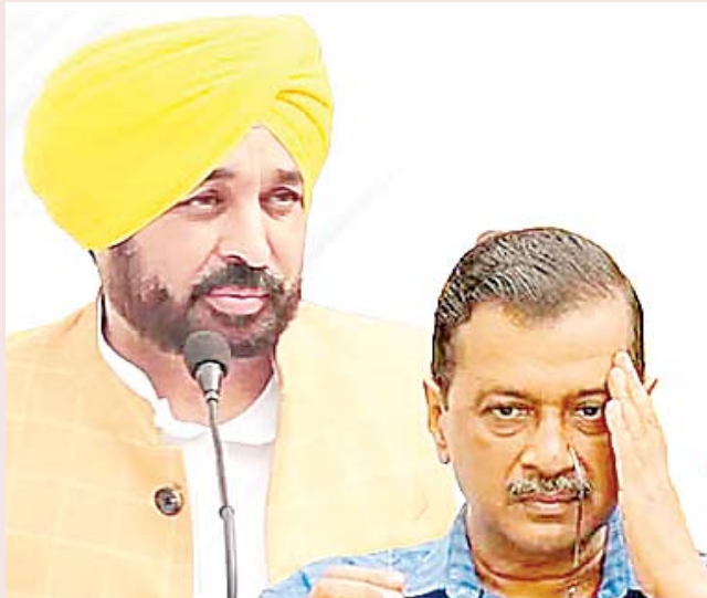
में पंजाब में वीआईपी कल्चर पर लगाम कसती दिख सकती है। वीआईपी

जालंधर (अंशु कपूर) : दिल्ली नतीजों पर पंजाब में भी जश्न है। लेकिन जश्न भाजपा की जीत का नहीं बल्कि आप की हार का है। सबसे हैरत वाला पहलू यह है कि आप समर्थक भी पार्टी की हार पर दबी जुबान से खुशी व्यक्त कर रहे हैं, जिससे पार्टी के भीतर का असंतोष सामने आया है। दूसरी तरफ सोशल मीडिया पर जबरदस्त प्रतिक्रियाओं व कमेंट्स ने साफ किया कि आप के लिए आने वाला समय चुनौतीपूर्ण रहेगा। भविष्य में पंजाब के सियासी मौसम के करवट लेने की संभावना से इन्कार नहीं किया जा सकता। दिल्ली में भाजपा की जीत को राजनीति विश्लेषक पंजाब में नई राजनीति शुरू होने का संकेत मान रहे हैं। जिन वादों व दावों के साथ आप सत्ता में आई थीं, अब उनको तक्जो मिलने की उम्मीद है। आने वाले दिनों