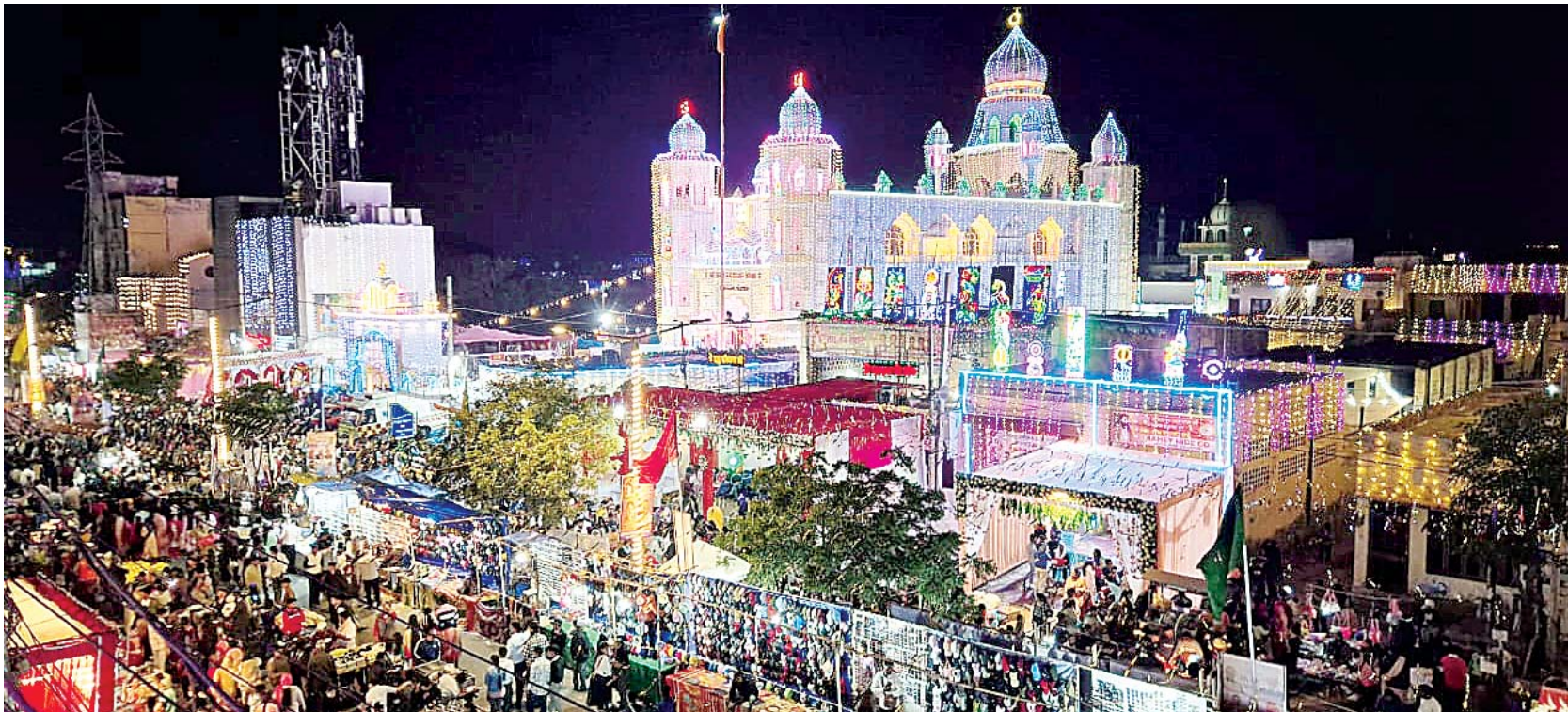
श्री गुरु रविदास जी के 648 वे प्रकाश उत्सव पर रंग बिरंगी लाइटों से सजाया गया बूटा मंडी में स्थित श्री गुरु रविदास धाम।