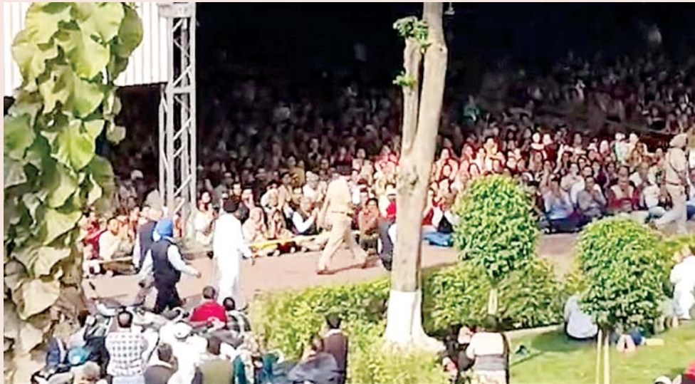
90 से ज्यादा देशों में फैली है संस्था : राधा स्वामी सत्संग ब्यास डेरा की स्थापना 1891 में जयमल सिंह ने की